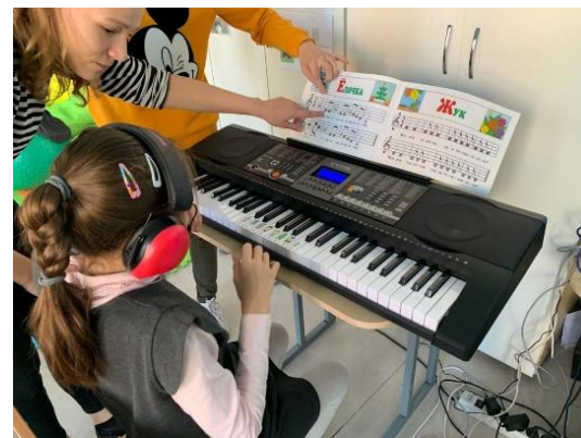
Сенсорная доска, парты, синтезатор в школе № 1514